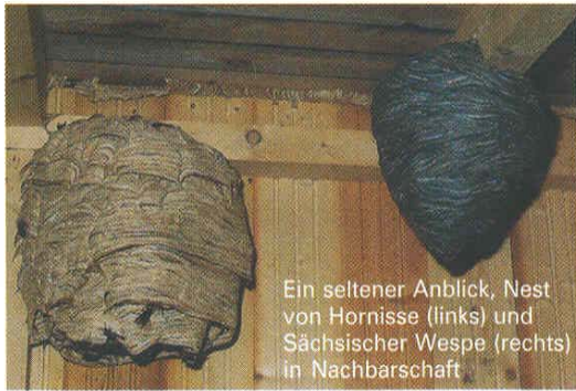
Ein seltener Anblick, Nest von Hornisse (links) und Sächsischer Wespe (rechts) in Nachbarschaft

Wespennester sind einjährig. Jedes Jahr wird ein neues Nest gebaut. Das alte Nest bleibt ungenützt.