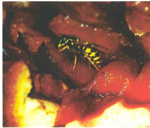
Wenn der Sonntagskuchen auf dem Gartentisch steht, können Deutsche und Gemeine Wespe lästig werden