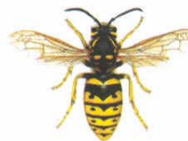
Gemeine Wespe ( Paravespula vulgaris )