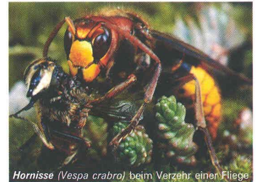
Hornisse (Vespa crabro) beim Verzehr einer Fliege

Wespen und Hornissen füttern ihre Brut ausschließlich mit Insekten. Ein Hornissenvolk fängt pro Tag so viele Insekten (Fliegen, Mücken, Motten usw.) wie fünf Meisenpärchen an ihre Jungen verfüttern. Ein Wespenvolk der Deutschen oder Gemeinen Wespe mit einer Volksstärke von über 10.000 Tieren braucht etwa die drei- bis vierfache Menge.