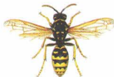
Gallische Feldwespe ( Polistes dominulus )