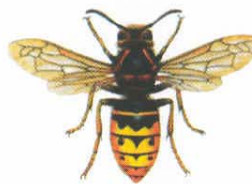
Mittlere Wespe ( Dolichovespula media )