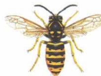
Sächsische Wespe ( Dolichovespula saxonica )