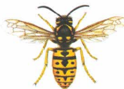
Deutsche Wespe ( Paravespula germanica )